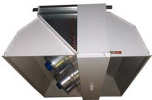
Plafonnier Cubique & plénums