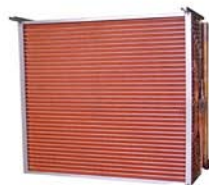
Batteries Cuivre / Cuivre