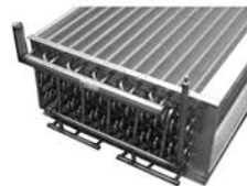
Batteries tout Inox