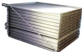
Batteries Inox tubes lisses