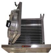
Evaporateur tout inox & batterie tubes lisses