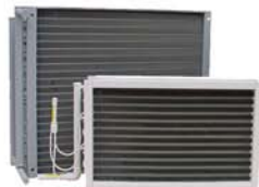
Batteries Cuivre / Aluminium