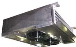
Double Flux tout Inox