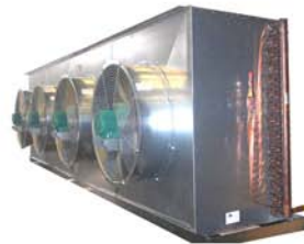
Super Plafonnier Industriel