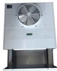
Evaporateur Mural Industriel