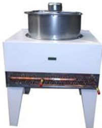
Condenseur & ventilateur ATEX